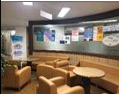
휴게실(효원산학협동관 2층 이노카페)