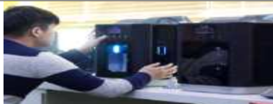
3D 프린터 등