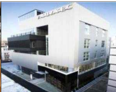
휴게실(효원산학협동관 2층 이노카페)