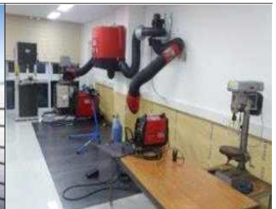
시제품 제작지원 공간(V-SPACE)