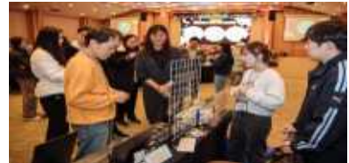
(창업기업 만남의 장) 네트워킹