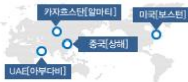
해외 지사 연계 지원