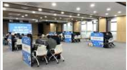
경기 스타트업 플렉스