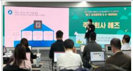
K-스케일업 데이(IR, 네트워킹)