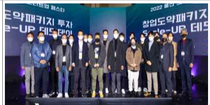
스타트업 페스타 스케일업 데모데이