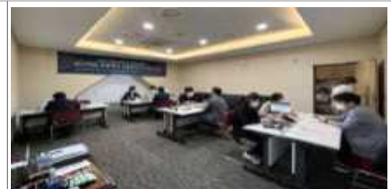
임상의 네트워크 지원