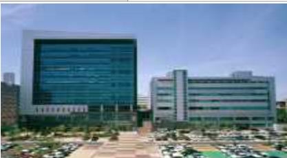
창업기업 입주 공간