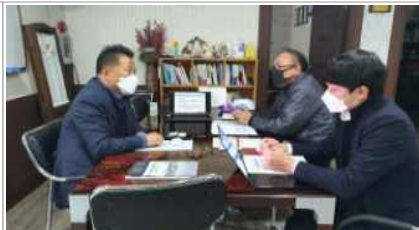
ESG 측정 및 경영진단