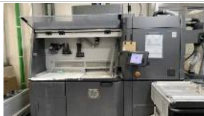
시제품 제작지원 장비