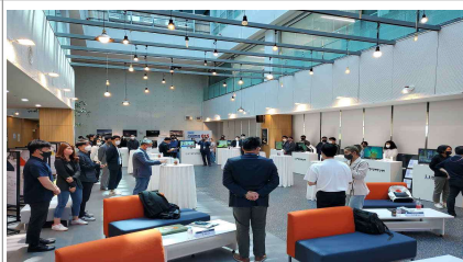
정기 Closed 투자 IR