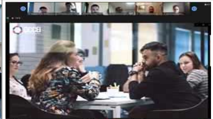
글로벌 스타벤처 프로그램